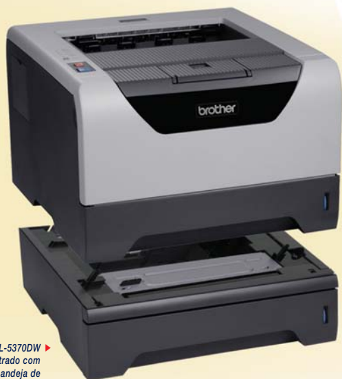
HL-5370DW ► mostrado com a bandeja de papel opcional*

A HL-5370DWT inclui todos os recursos da HL-5370DW mais uma 2ª bandeja de baixo como padrão. Este modelo é ideal para usuários que necessitam de todos os recursos da HL-5370DW, porém deseja uma capacidade de papel adicional e também flexibilidade para armazenar e usar papéis de tamanho carta e ofício.